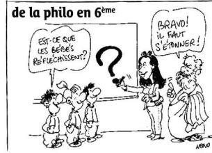
En couverture : Nano s'est inspiré de l'ambiance de l'atelier philo en sixième