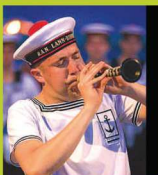
► Le Likes et après... Dans l'Bagad de Lann Bihoué... é!