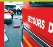
► Santé - Sécurité Mieux vaut prévenir...