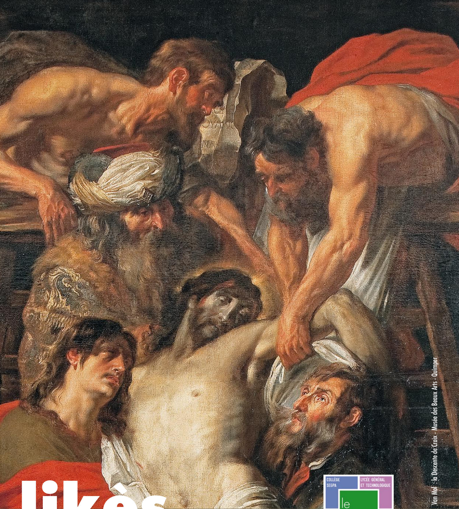
Van Mool : la Descente de Croix - Musée des Beaux Arts - Quimper