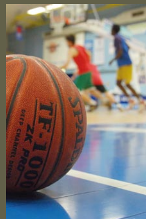
Des likésiens sur le plancher de l'UJAP